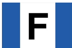
FOLKEBOOTE R.: 1,3